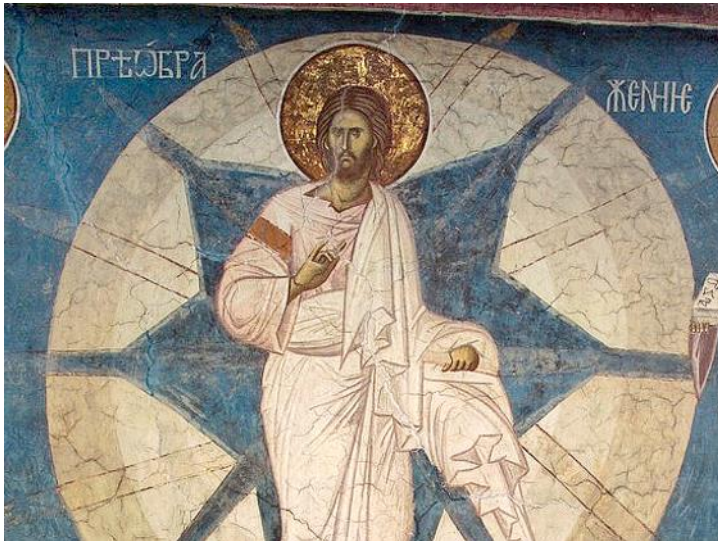
La Transfiguración, Monasterio Decani

por un lado descendiendo desde Sus alturas, y por el otro elevándonos de la profundidad de nuestra naturaleza caída.