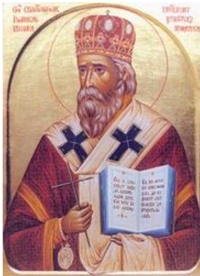
Ícono del Santo Nuevo Mártir Joanikije

Pero ¿qué vemos hoy? ¿Acaso la gente, acaso los cristianos, seguidores de Cristo se rigen por este mandamiento? Desafortunadamente, son muy pocos los que lo hacen. En vez de que gobierne el amor hacia Dios, lo que rige son la indiferencia hacia Él y la confianza en el poder humano; en lugar del amor al prójimo, gobierna el odio que emana del grosero materialismo y del vil egoísmo. Desgraciadamente, actuando de esta manera tanto el hombre como naciones enteras nunca alcanzarán la felicidad sino más bien la infelicidad. Esto ha llevado a la humanidad hacia esta guerra actual (la Segunda Guerra Mundial, N. del T.), la cual sólo trae un gran sufrimiento a las naciones de todo el mundo. Por eso es necesario que el ideal de cada hombre entre en acción, según sus fuerzas se lo permitan, y se detenga tan pronto como sea posible esta