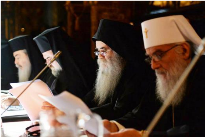
S. S. Patriarca Serbia Irinej y S. E. R. Metropolitano Amfilohije en el Concilio representando a la Iglesia Ortodoxa Serbia

4. Una amenaza fundamental para la justicia y la paz -tanto a nivel local como a nivel mundial- es la crisis económica mundial. Las ramificaciones de ésta son evidentes en todas las capas de la sociedad, donde valores como la integridad personal, la solidaridad fraterna y la justicia a menudo faltan. Los orígenes de esta crisis no son meramente financiera. Son morales y espirituales en carácter. En lugar de conformarnos a los ídolos mundanos de poder, la codicia y el hedonismo, hacemos hincapié en nuestra vocación de transformar el mundo, asumiendo los principios de la justicia, la paz y el amor.