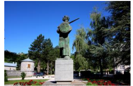
Estatua de Ivan Crnojević, en Cetinje

tumba de su antepasado cristiano, el gobernante ortodoxo Ivan I Crnojević.