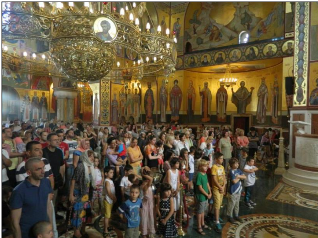
Dentro de la majestuosa Catedral de Podgorica

Luego, el viaje continuó en recorrido por el Skadars-