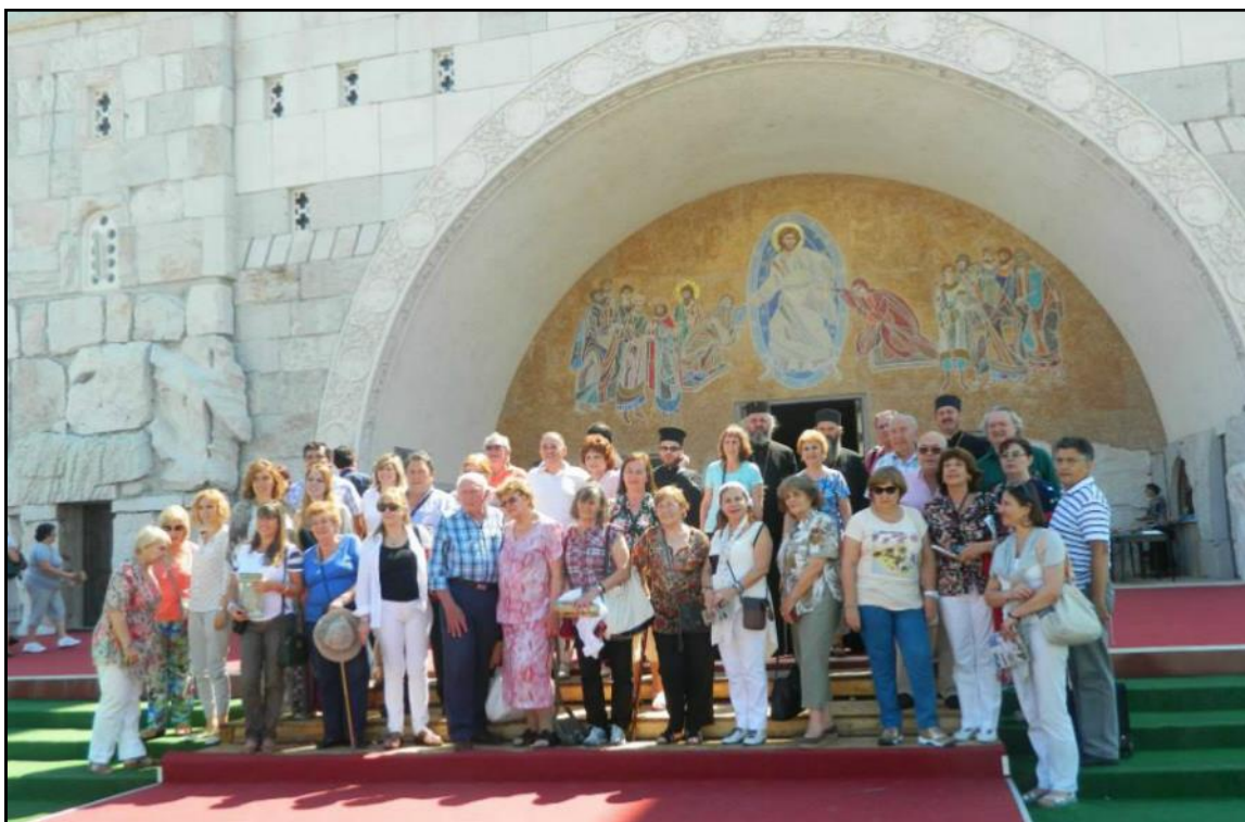
El grupo en la Catedral de la Resurrección del Señor, en Podgorica, Montenegro

La comunidad de Chaco realizó un viaje por las ciudades y monasterios de Serbia, Montenegro y República Srpska