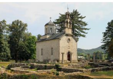
Iglesia de Cipur donde están los restos de Ivan Crnojević y donde se llevó a cabo el bautismo

Mahmud-Pasha Bušatlija (muerto en 1796) fue el Visir del Pashalik albanés de Scutari. Fue derrotado en su intento de someter a Montenegro en 1796, y fue decapitado por un guerrero de un clan de Montenegro.