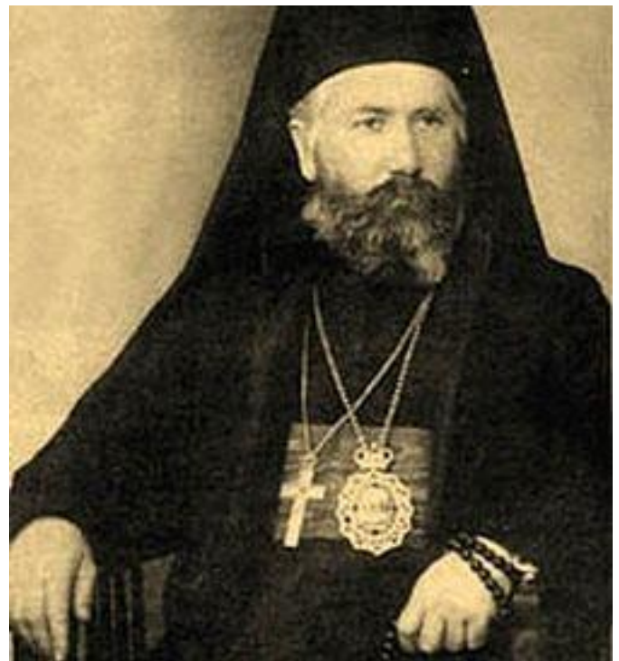
Foto del Santo Nuevo Mártir Joanikije