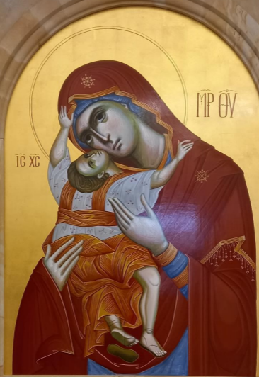
Ícono de la Madre de Dios Iconostasio del templo Santa Trinidad en Resistencia, Chaco - Argentina