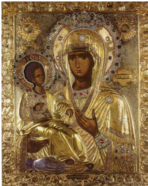
Madre de Dios “Trojeruchitsa” o “de las Tres Manos”