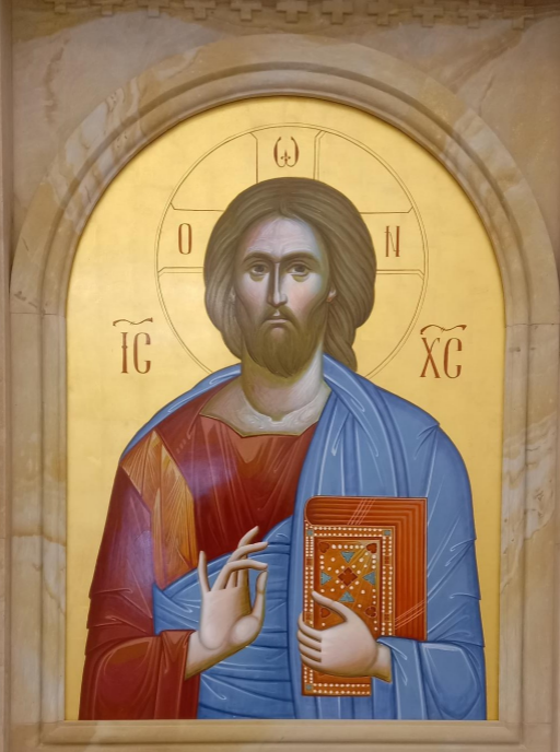
Ícono de Nuestro Señor Jesucristo Iconostasio del tiempo Santa Trinidad en Resistencia, Chaco - Argentina