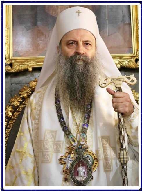
SU SANTIDAD ARZOBISPO DE PECH, METROPOLITA DE BELGRADO Y KARLOVAC Y PATRIARCA SERBIO PORFIRIJE